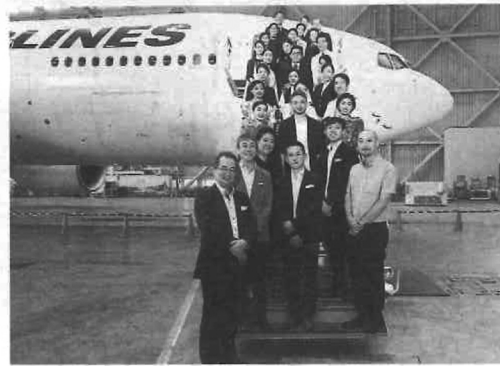
新制服をバックにした製作関係者の写真。客室乗務員が着用する流線型のシルエットのワンピースには、パルーンスリップを取り入れた。業務の動きにも配慮して設計している。

伊藤忠商事100%子会社でユニフォームの企画・製造・販売を手掛けるユニコ(東京都中央区)は、日本航空(JAL)が2020年4月から使用する新制服を受注した。2年前に伊藤忠から営業機能を移管して以来、初めて単独でプレゼンを勝ち抜き、大型案件を獲得。一般企業に向けた大きなアピールにもなり、今後のOEM/ODMの拡大に弾みをつけた。